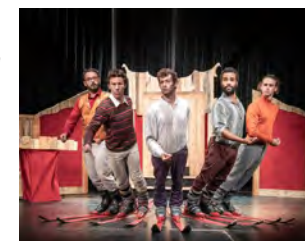
Compagnie Kadavresky